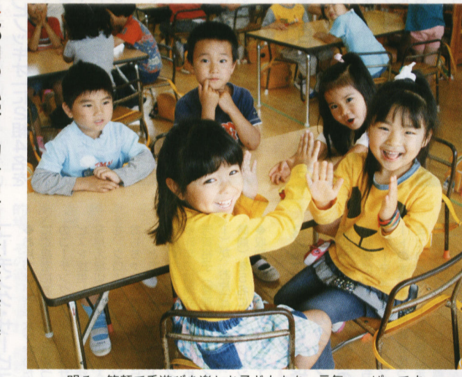
明るい笑顔で手遊びを楽しむ子どもたち、元気いっぱいです

この大会は、私学の格差是正をめざし、私学全体の健全な育成教育条件の維持向上及び保護者負担の軽減を図るため、都内の私立幼小中高が一つに結集して都の行政当局にお願いするものです。今回も幼小中高の父母約千二百人、うち幼稚園は百人が参加し、熱気あふれる大会となりました。