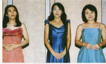
フィガロ音楽企画の3人