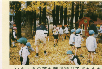
いちよりの落ち葉で遊ぶ子どもたち

昨年の十一月二十七日(火)、千代田女学園大講堂において、要望期成大会が行われました。会場では音楽とパフォーマンスで盛り上げながら、子どもだけではなく親も交通ルールをきちんと守ってほしいと訴えられました。お二人はこれからも楽しく学べる交通安全・防犯活動に邁進されることでしょう。