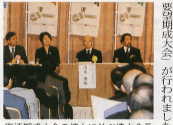
復活期成大会の壇上に並ぶ清水会長