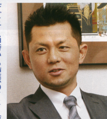
まとは こうじさん 的場 浩司さん (俳優)