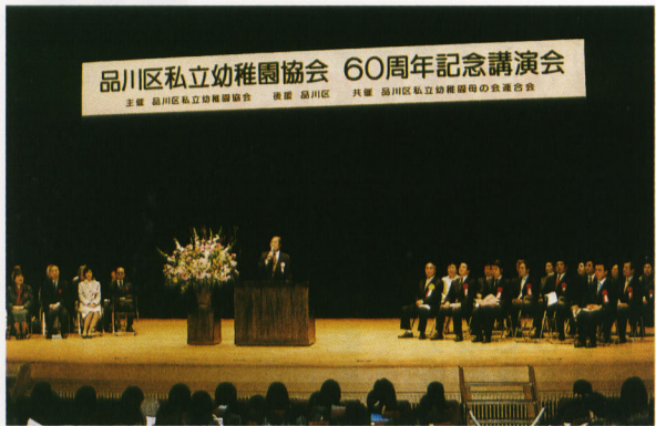
講演会は品川区立きゅりあん大ホールで盛大に開催された