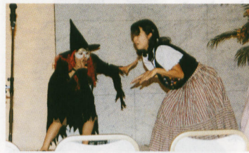
ヘンゼルとグレーテルの1シーン