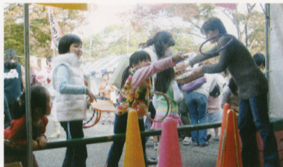
ふるさと渋谷フェスティバルで輪投げゲーム

品川区母の会連合会の活動は年に一度の講演会を実施することにとどまらず、保護者を集めた勉強会、募金集め、幼児教育の大切さを訴える会報の発行など、日頃から様々な活動を行っ