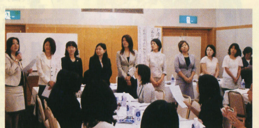
都私幼P連役員の方たち