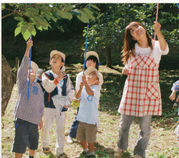
幼稚園の近くの公園で昆虫採集。何をねらっているのかな？