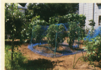
子どもたちがお世話する野菜畑

結核とは、結核菌によって主に肺に炎症を起こす病気です。結核菌は重症の結核患者がくしゃみやせきをした時に飛び散り、それを周りの人が直接吸い込むことによって感染します。しかし、通常は免疫機能が働いて菌の増殖を抑えるため発症はしませんが、免疫機能が弱まると発症してしまいます。また、早期発見すると周りにうつさずに済みます。 昨年、日本では九十五人の子ども(十四歳以下)が結核にかかりました。子どもがかかるのと髄膜炎になることもあり、寝たきりになってしまうこともあります。せきが二週間以上続く、時のかぜの症状が長く続く時は、結核ではないかと疑い、受診する必要があります。 また、結核を予防するにはBCG接種が有効です。生後六ヶ月までに接種しましょう。