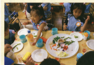
生野菜をもぐもぐパクパク

園庭から お父様先生・お母様先生が イベントを盛り上げる素敵な園 大田区・サムエル幼稚園 日野 史乃 「もぐもぐパクパク食べるうちに飲み込まれちゃったし、ずく君、そこで出会うたカラフル野菜。体にいいもの食べてるね。」 そんな楽しいサムエル幼稚園のオリジナル曲を歌いながら子ども達が向かうのは、園庭にある畑です。ナスやキュウリ、トマトなど、クラスごとに何を育てるかを決め、苗を植え、お世話をしました。「ナスはお花も紫だけど、キュウリは黄色だよ!」赤ちゃんとママは緑なんだよ!そんな新しい発見を娘は毎日、笑顔で報告してくれました。 でも、私には心配事がありました。実は娘は大の野菜嫌いです。食べるのを嫌がってぐずったりしないからと、あえて娘から離れた席を選んで遠目に見守っていました。すると、なんと娘は生野菜をパクパク食べているのです! お野菜がおいしいのか、お友達に食べさせているのか、はわかりませんが、普段我が家ではお目にかかれない光景 幼稚園に入ると子どもは様々な経験を通して爆発的に成長していきます。その様子をハラハラしつつも楽しみにしながら、親も成長していきます。そんな、子どもにとっても親にとってもかけがえのない日々を、文字通り園を開放して見守り、応援して下さるサムエル幼稚園の先生方に、感謝の気持ちでいっぱいでした。 このようにお手伝いする父母を、サムエル幼稚園ではお父様先生・お母様先生と呼び、イベントのたびに募集がかかります。そう、この園では参観日とは別に、父母が直接保育に参加できる場があるのです。それは、わが子の園での姿が、友達関係はもちろんなクラスの様子まで肌で感じられる、とても貴重な体験です。