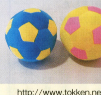
ファンファンボール

◆トッケンでは子どもたちの安全・安心のために遊具の安全点検を行っています。園内の遊具、備品等の点検、住宅地内などにある公園遊具の点検など遊具に関することなら何でもご相談ください。また、ご家庭にお望みの特注サイズの遊具も、ご希望に合わせて作りいたします。お気軽にお電話ください。 03-5741-1561 http://www.tokken.net