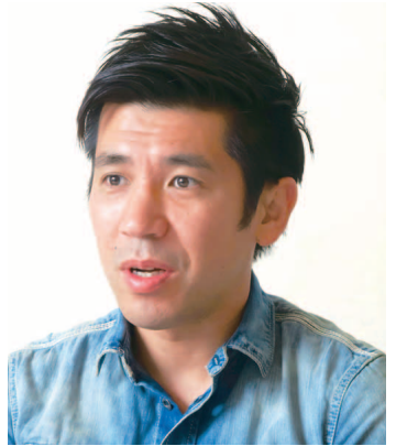
ガレッジセール/ゴリさん (お笑いタレント)

●プロフィール/1972年、沖縄県那覇市生まれ。95年5月に同級生の川田(愛称・川ちゃん)とお笑いコンビ「ガレッジセール」を結成し、同年7月に初舞台を踏む。その後、『笑っていいとも!』など多数のレギュラー番組を持ち、「ゴリエ」のキャラクターでもお茶の間の人気を獲得。また俳優として映画、ドラマに出演するなど幅広く活躍の場を広げ、06年には初の監督作品『刑事ボギー』でショートショートフィルムフェスティバルの話題賞を受賞している。最近では、情報バラエティ番組『にじいろジーン』(フジテレビ系/毎週土曜8:30~9:55)などに出演中。1男1女の父。