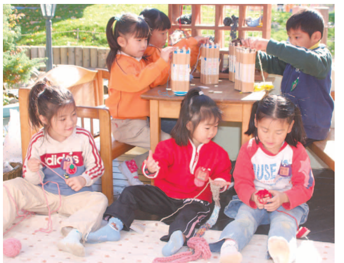
「何を作っているのかな？」作品づくりにみんな夢中で、楽しそう