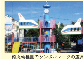
徳丸幼稚園のシンボルマークの遊具

昭和四十二年に創立され、来年度に四十六周年を迎える徳丸幼稚園は、板橋区内でも数少ない緑多き高台に位置し、閑静な住宅街に包まれた、教育環境として恵まれた立地条件の中にあります。