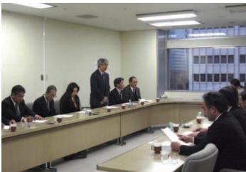
都議会自民党に要望する都私幼連とP連

今回オープンしたホームページでは、教養講座や研修会などの開催スケジュールを確認することができます。また、過去の「PTAだより」をダウンロードして閲覧できます。是非ご活用ください!