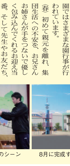
園長先生の手品のシーン

こうした行事のお手伝いや毎日のお弁当作りを通じて、初めての子育てを応援する姿は、四十五年の長い年月を経ても、我が子を想う親の姿は今も昔も変わらないようです。