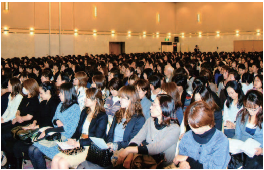
都内全域から多数の保護者がつめかけた