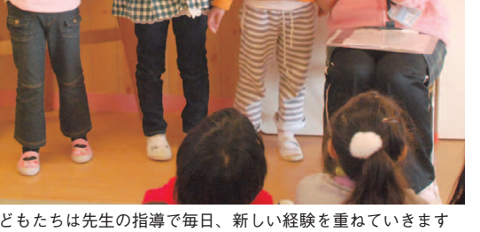
子どもたちは先生の指導で毎日、新しい経験を重ねています

き合いで次の三つを心がけてください。一つは「必ず私から笑顔で挨拶する」、二つ目は「他人の悪口は絶対に言わない」、三つ目は「群れない」ということです。