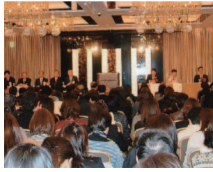
復活期成大会で父母の願いを訴える