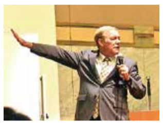
ユーモアたっぷりの講演は大好評

第二十三回都私幼P連大会第2部の「講演」では、タレント、山形弁研究家、教育者、翻訳家など様々な分野で活躍中のダニエル・カール先生をお招きし、ダニエルの子育て論を山形弁交じりにユーモラスにお話しいただきました。