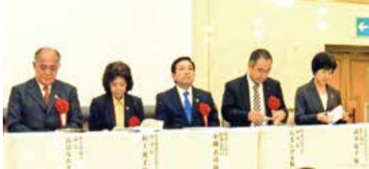
都議会議長をはじめ都議会各党の代表の方々

●プロフィール／1960年米カリフォルニア州モンロビア市生まれ。パシフィック大学で国際政治学を専攻。高校・大学時代に来日し、大学卒業後は日本に定着。山形県で英語指導に従事し、その後、営業マンやマスコミなど多くの仕事を経験して現在に至る。妻と息子の3人家族。