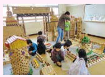
積み木やブロック遊びを楽しむ

日本大学幼稚園は自主創造の気風を尊ぶ日本大学の付属幼稚園です。来年には創設八十八年を迎え、人に例えれば「米寿」になる、歴史に溢れた幼稚園です。昭和初期に既に「歯磨き教室」「園庭プール」というユニークかつ斬新な教育を始め、それは今も思っています。