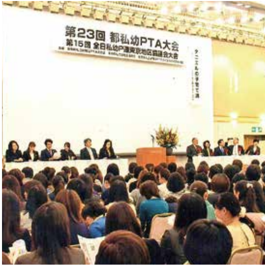
盛大に開催された第23回都私幼P連大会