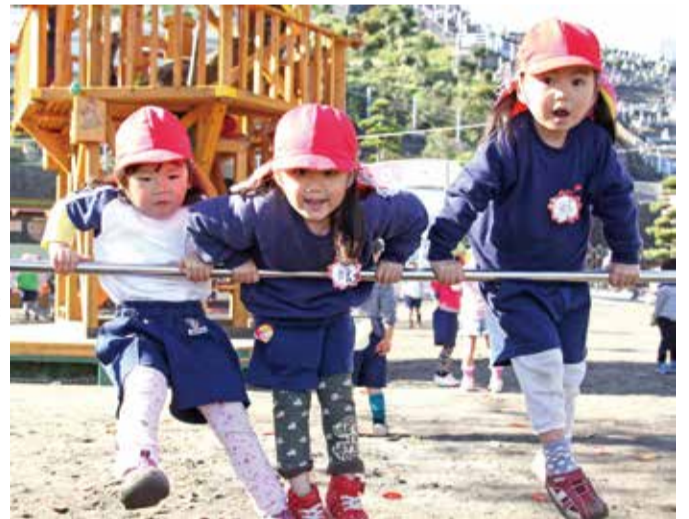
暖かい日差しに恵まれた冬の園庭で遊ぶ年少組の女の子。鉄棒の上で体を伸ばせるようになれば、すぐに前回りができますよ。