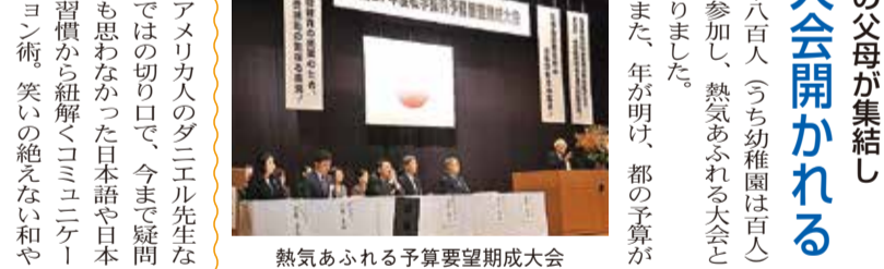
熱気あふれる予算要望期成大会

◆都内の私学・幼小中高の父母が集結し 予算要望期成大会開かれる 昨年十一月二十五日(火)、共立講堂において、「平成二十七年 都私幼P連 予算要望期成大会」が行われました。