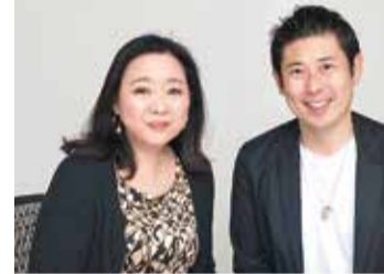
マギーさんの子育て協力はとても素敵です