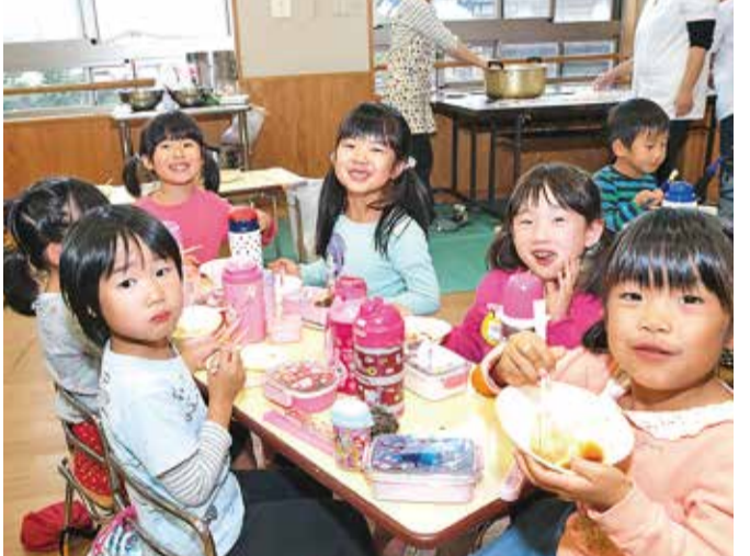
幼稚園の「おもにつき大会」のあと、できたてのおもちをみんなで食べました。「おいしいね」ってみんなニコニコ…