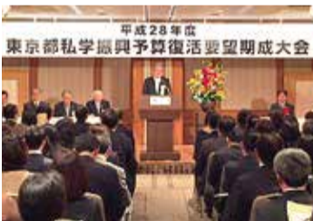
予算復活期成大会で保護者の願いを訴える

今回も幼小中高の保護者、約部屋の外で立ち止まりました。その時、彼は自分もこんな風に読んでもらった、最近ほれられることも多いけれど、愛情を注いでもらっている、と感銘を受けたのではないのでしょうか。この瞬間、読み聞かせの大切さを