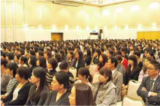
会場には都内全域から多数の保護者が詰めかけた