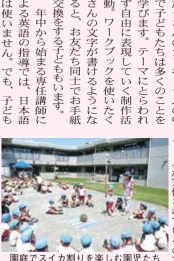
園庭でスイカ割りを楽しむ園児たち

年間を通して水泳指導があり、丈夫な体作りができます。一年を通して行事もたくさんあります。運動会では年少の可愛いダンス、みんなで協力して完成させる年中のバラバールン、年長の組体操では伝統の「さとうタワー」が披露されます。発表会ではお餅つきや、年長が作ったカレー・スイートポテトを全園児でいただく活動、ホットケーキ・おにぎり作りなど、食育に関する行事では、自分たちが作ることに関わること、子どもたちは競っておいなりをします。中には今までの苦手だったものが食べられるようになる子どももいます。