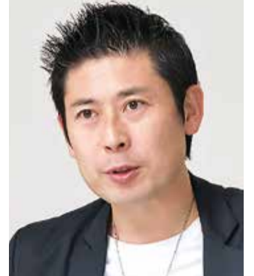
しんじ マギー 審司さん (お笑いタレント/手品師)

●プロフィール/1973年、宮城県生まれ。小学生の頃からマジックに興味を持ち、高校卒業後単身アメリカに渡り、プロのマジシャンの下で修行をする。94年マギー司郎に弟子入りし、師匠譲りの喋りのマジックで注目を集める。以後、ライブ・テレビ・ラジオ・CMなどに出演。NHK『爆笑オンエアバトル』で負けナシの10連勝を記録。2005年、第21回浅草芸能大賞新人賞受賞。現在は、みやぎ夢大使や地元気仙沼大使など地元アピールに貢献。子ども向け番組、マジック書籍の発売など多岐に渡り活動中。2女1男の父。