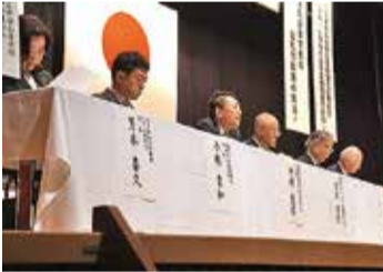
熱気あふれる予算要望期成大会

内示された翌日の一月十六日（土）には、新宿・ハイアットリージェンシー東京において「予算復活要望期成大会」が行われ、教育環境の向上や保護者負担の軽減など、保護者の願いを再度、力強く訴えました。