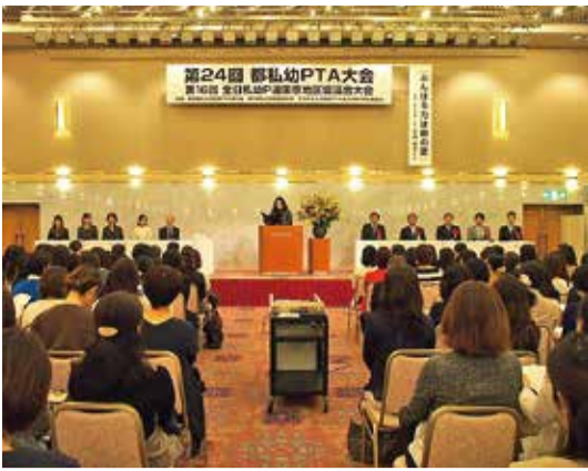
盛大に開催された第24回都私幼P連大会