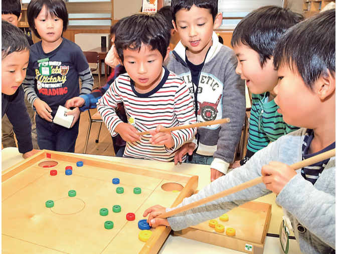
玩具のビリヤードゲームで遊ぶ男の子たち。「狙った通りに玉を突けるかな？」みんな表情は真剣そのものですね。

月本 幼い子どもにとつて、親は絶対的な存在ですからね。父親は一番怖いけど、一番優しいし、一番守ってくれていることに、子どもはあとから気づくものなんです。