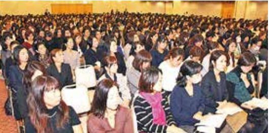
会場には都内全域から多数の保護者が詰めかけた