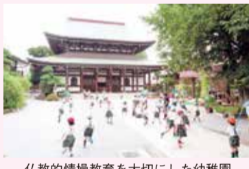
仏教的情操教育を大切にされた幼稚園

都心とは思えない豊かな自然に囲まれた、まこと幼稚園は昭和二十五年に開園し今年で創立七十周年を迎えます。まこと幼稚園は、曹洞宗龍寶山萬昌院功運寺と同じ敷地の山にあり、山門を抜けると正面には美しいお顔のお釈迦様が園児たちの無事と安全を見守ってくださっています。当園では仏教的情操教育を大切にしています。ポニーや馬ウサギやチャボ、犬などの飼育動物との愛情を込めた触れ合いや、お世話を通して、子どもたちの中にいたわり、かわいがるという気持ちが生まれます。園庭では大根やトマト、キュウリといった野菜や稲を栽培し、その恵みをいただく(食す)ことで、感謝の気持ちを育みます。