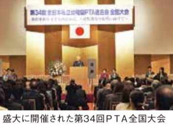
盛大に開催された第34回PTA全国大会

子どもたちは、園内にあるクッキングルームで、収穫した作物を調理して食べたり、お家に持ち帰ったりします。無農薬で栽培して育った野菜は、どれもとてもおいしくて、自分たちで採った喜びも合わせ、日頃は食べないサラダなど苦手なものも食べるようになりまし