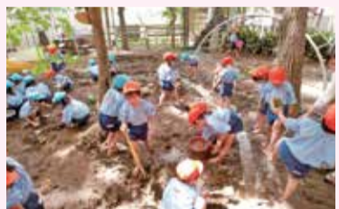
砂場で裸足になってどろんこ遊び

冬のお楽しみはお相撲さんをゲストにお迎えして、お餅つき大会を開催します。園児たちは、つきたてのお餅をおいしくいただきます。子どもたちは広い園庭でたくさんのお話を体験し、毎日の遊びの中でルールや、お友だちの優しさを学びます。愛情一杯の先生方に見守られるのびのびと幼稚園生活を過ごしています。今日もまた先生の弾くピアノの音色に合わせて、子どもたちの元気な歌声が園庭に響いています。