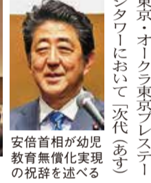
安倍首相が幼児教育の重要性を述べた

すべての子どもにも良質な教育を 幼児教育振興法の成立を目指す PTA全国大会開かれる 全日本私立幼稚園PTA連合会(河村建夫会長)は、昨年十月十日(火)、午後一時から東京・オークラ東京プレステータワーにおいて「次代(あす)を担う子どもたちのために幼児教育の振興に向けて」をスローガンに、第三十四回PTA全国大会を開催しました。