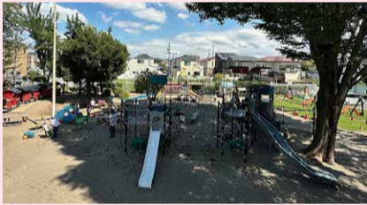
大きな木陰に守られて、夏でも元気に外遊び

方々に元気に挨拶する園児の姿がしばしば見られます。また、園の活動の特徴として、一九九九年から「英語あそび」を導入しています。ネイティブスピーカーの先生が二名常勤しており、英語を日常的に耳にし、英語に接する機会を大切にしています。課外クラブも充実しているから、たくさんの選択肢の中から子