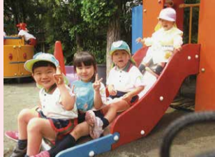
子ども同士はみんな仲良し!

年間を通して、納涼会・運動会・お遊戯会や音楽会(一年おき)・クリスマス会・餅つき