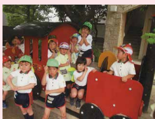
遊具がみんなのお気に入り

このように、葛飾若草幼稚園の子どもたちは、素晴らしい体験を重ねて、日々成長しています。