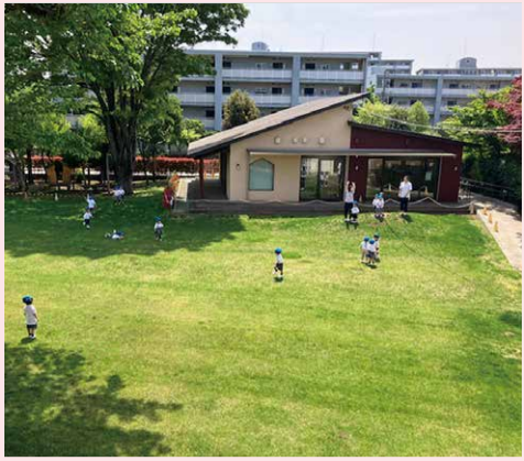
広い芝生で思いっきり駆け回る子どもたち。裸足で遊べる園庭。大きな樺の木が、夏には影を作り、秋にはそよよと枝をゆらす