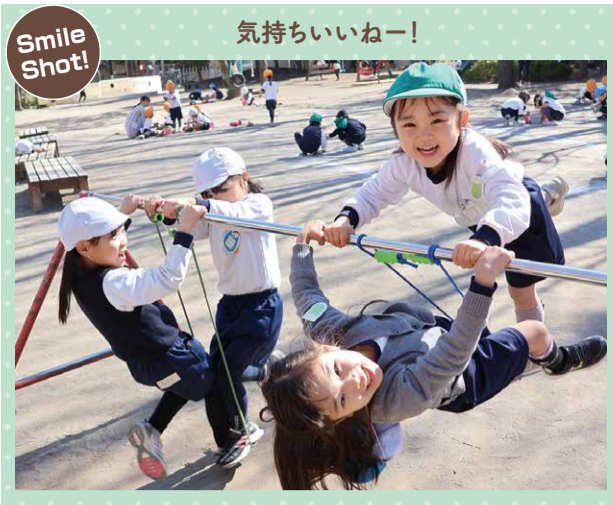
Smile Shot! 気持ちいいねー!