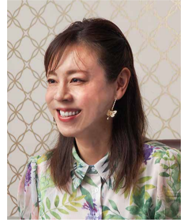
たかはし まあさ 高橋 真麻 さん (フリーアナウンサー)

月本 真麻さん、子育てにどのように関わっていますか。 高橋 夫はもとも幼児教育に携わっていた人なので、頼りになります。子どもが生まれてから、あらためて尊敬することもありました。