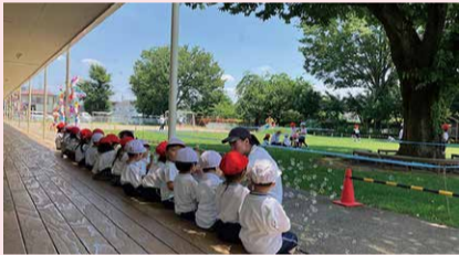
教室前のテラスでシャボン玉遊び

園庭で外遊びをする在園児からは、「こんちはー」という元気な声が聞こえます。それは園の教育の中でも、挨拶の大切さを指導しているからです。保護者や園を訪れた