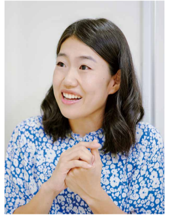
よこさわ なつみ 横澤 夏子 さん (芸人・タレント)