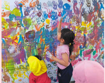
触れて、見て、感じて、遊びそのものが学びになっていく

また、3頭のポニーを育てながら、排泄物が肥料になるという自然の知恵や毎日続けることの大切さ、生命が循環する不思議、命のほかなさ・ありがたさを、肌で感じながら学びます。