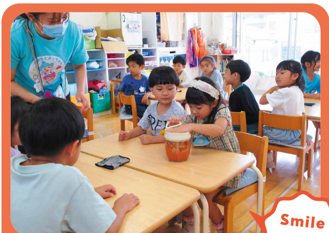
にんじんドレッシングができてきたよ!