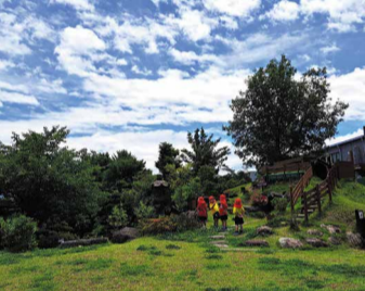
自然豊かな遊楽園でワクワクドキドキ！思い通りにならないことが心を育てる

先生方も子どもたちの素直な問いに耳を傾け、一緒に考え、互いの学びを深め合う。この積み重ねが、元気と根気強さを育てるのです。