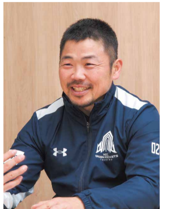
たなか ふみあき 田中 史朗 さん (元ラグビー日本代表)

1985年京都府生まれ。元ラグビー日本代表のスクラムハーフ。世界最高峰の海外リーグ「スーパーラグビー」で日本人初の選手となる。日本代表として2011年から3大会連続でW杯に出場。2015年の南アフリカ戦では「マン・オブ・ザ・マッチ」に選ばれた。2024年に現役を引退し、現在はNECグリーンロケッツ東葛でアカデミーディレクターを務める。3児の父。